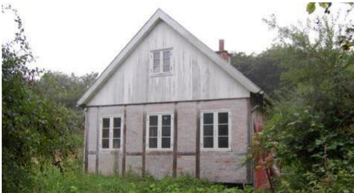
"Hellener Hytten" som den så ud 2018.

Helleneren Gunnar Sadolin blev med tiden mere og mere interesseret i at fremstille gode og holdbare malerfarver og var med til at stifte Sadolin og Holmblad.